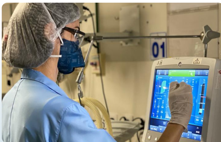
A Santa Casa foi o primeiro hospital do Sul do Estado a atuar no combate a COVID-19

Em um ano de pandemia causada pelo novo coronavírus, a Santa Casa de Misericórdia Cachoeiro mais uma vez mostrou sua importância para a população do Sul do Estado.