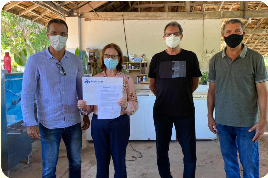
O projeto tem uma forte atuação social e gera economia para o Hospital Santa Casa

O Sicoob Credirochas e a Santa Casa de Misericórdia Cachoeiro renovaram o contrato para a realização do projeto de ressocialização de internas do presídio de Cachoeiro por mais um ano, que acontece na Fazenda da Santa Casa.