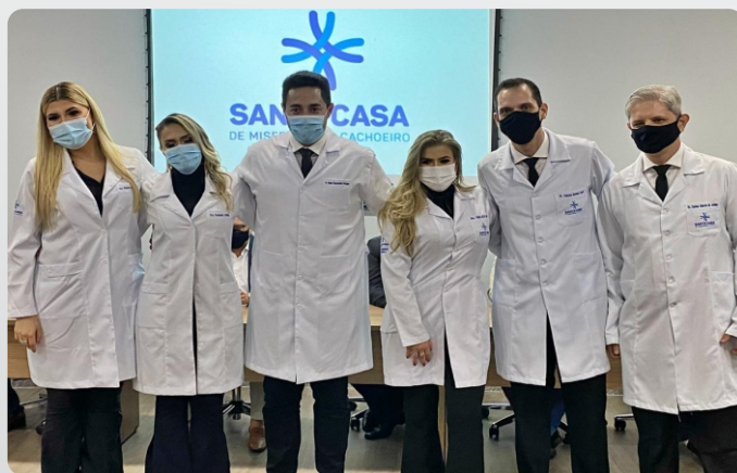
O evento foi realizado seguindo todas as recomendações de segurança em combate a COVID-19

“O sentimento agora é de vitória. Esse é um dia muito especial para todos nós. Essa residência aqui foi uma escola. Não teve um dia, uma hora ou um minuto em que não aprendemos alguma coisa nesses dois anos. Então a gente agradece muito à instituição pela acolhida que tivemos aqui”.