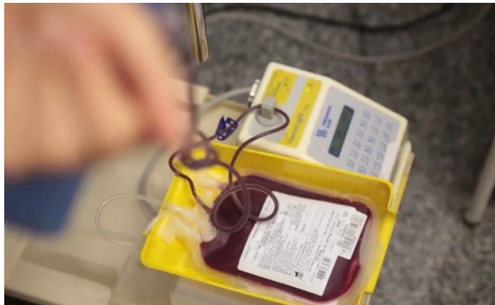
Em 20 minutos o doador ajuda a salvar até quatro vidas

Com a chegada do verão, a maioria das pessoas aproveitam para tirar suas tão merecidas férias. Por isso, o número de veículos nas estradas aumenta, e como consequência, o de acidentes também.