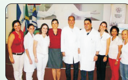
Patrocinadores: Banco do Brasil, Caixa Econômica Federal e Agera